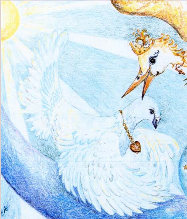
De wachter van de ziel

rots aan! Hij wreef over zijn pijnlijke hoofd. “Hoe kan dat nu?”, vroeg hij zich af, terwijl de andere dieren er gewoon dwars doorheen gingen. Hij probeerde het nog eens, en nog eens. Het lukte het beertje maar niet. Moe en boos van het proberen begon het weer te huilen.