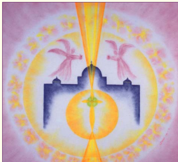
De genade van het christusbewustzijn

De 12 auramiddelen nemen de blokkades in het bewustzijn weg die de mens belemmeren om als lichtwezen te groeien, oftewel de universele liefde en harmonie te vermeerderen. Want dat is mijn missie in dit leven: de mens zijn/haar vrijheid terug te geven om spiritueel te kunnen groeien.