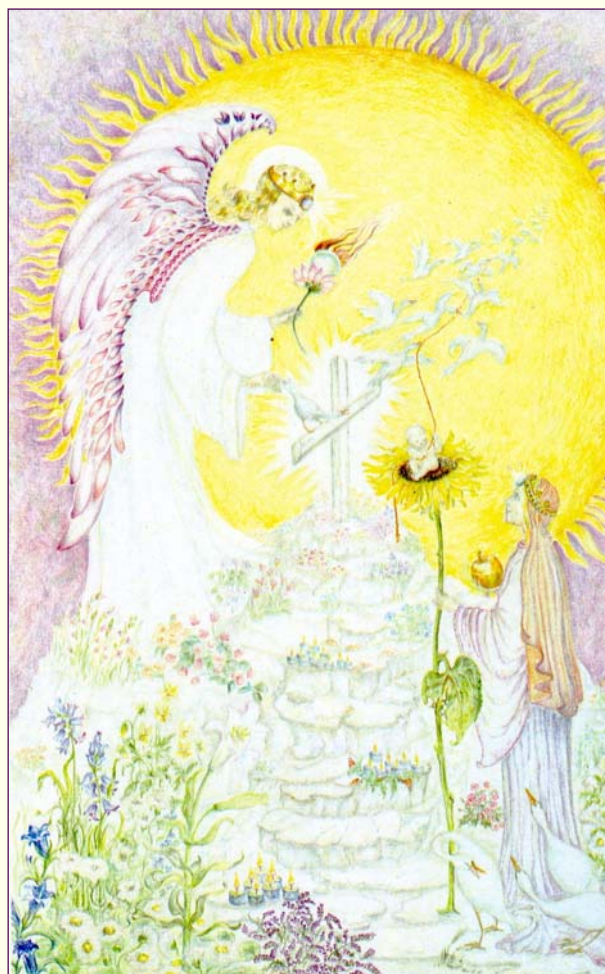
Het lijden voorbij