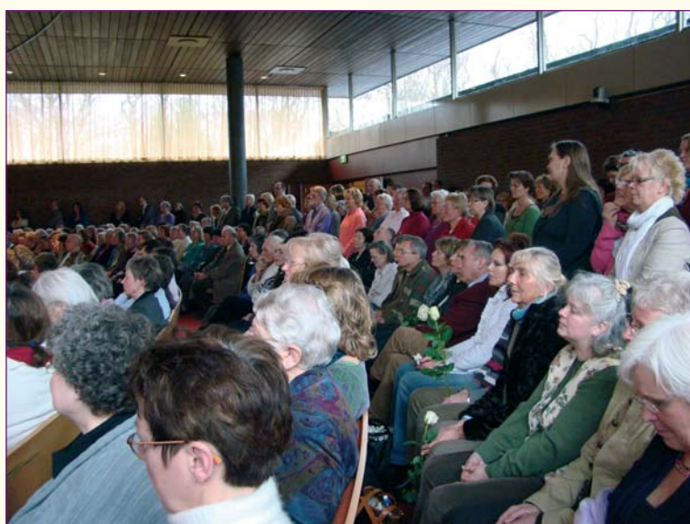
...en heel veel belangstelling.