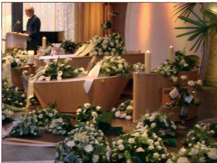
Er was een zee van bloemen ...