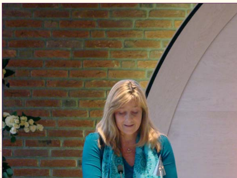
Er waren toespraken van onder meer de kinderen ...