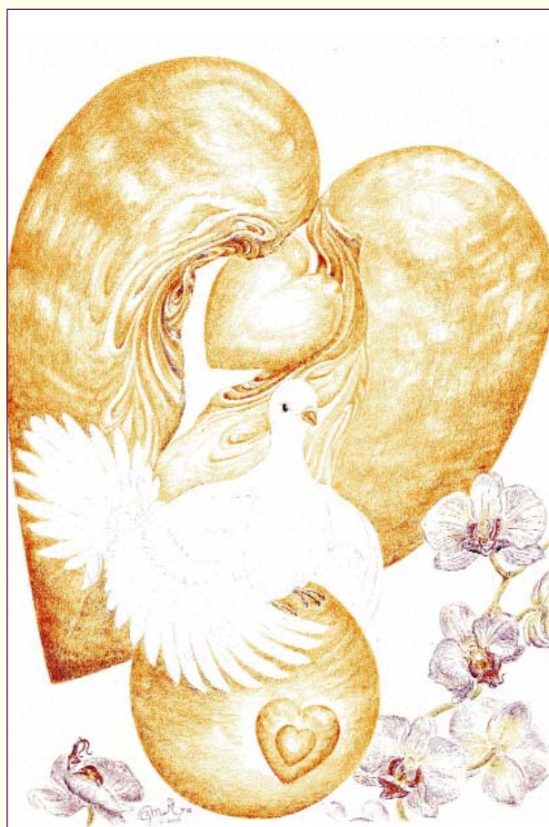
De Gouden Ark

Het leven schuift – door de toenemende kracht van de aquariusblauwdruk – langzaam het nieuwe in. En dagelijks vinden er nog nieuwe bekrachtigingen plaats! Tot en met het jaar 2011 is ook mijn agenda nog vol lezingen en themadagen om het hoogste deel van de aquariusblauwdruk te helpen bekrachtigen en nog verdere nieuwe aquariasmystiek te ontvangen. Niets kan de mensheid meer van de zege afhouden, want de belemmerende factoren zijn reeds volledig ontworteld. We koersen nu echt op een nieuw utopia af: de eindbestemming van de aquariusevolutie!