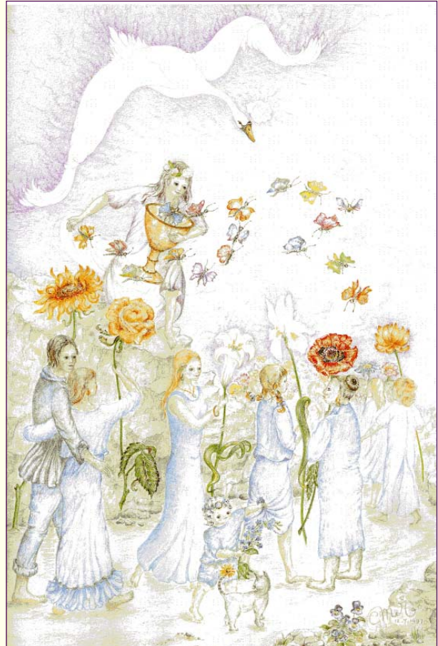
Ontvangen van Stilte

De Schepper heeft haast met zijn wereld tot de Geest te brengen! Geestelijke groei wordt daarom het doel van het leven en zes miljard mensen zullen dan ook hun bewustzijn tot goddelijke hoogte moeten ontwikkelen. Mede daarom is het perpetuum mobile op het thymus-