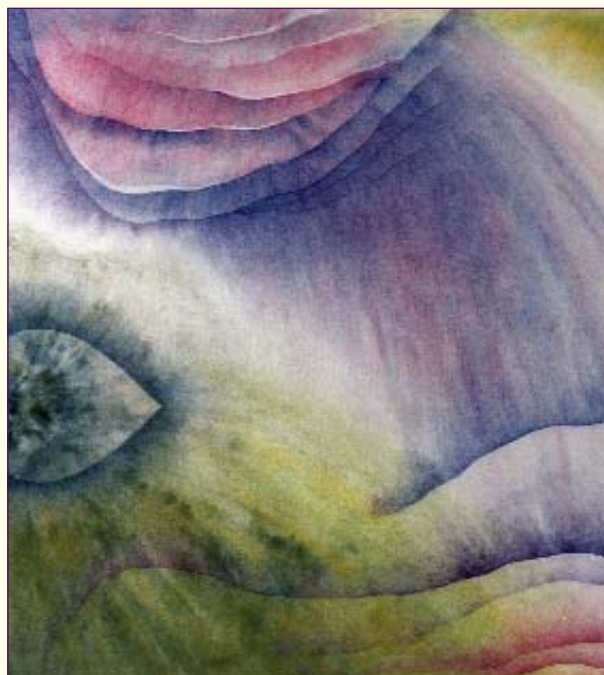
Ik ben geworden

Nu is deze taak voor élk mens weggelegd. Wij mogen – gaande op de inwijdingsweg – allemaal een Christus worden. Wij krijgen dan zélf de taak om een veiligstelling voor het leven te zijn. Op onze inwijdingsweg kunnen wij immers het bewustzijn van de aarde, de zon, het universum, de kosmos, enzovoort in ons bewustzijn integreren. Tot onze overgave totaal is en wij de schepping in ons bewustzijn dragen en de Schepper gelijk zijn. Wij