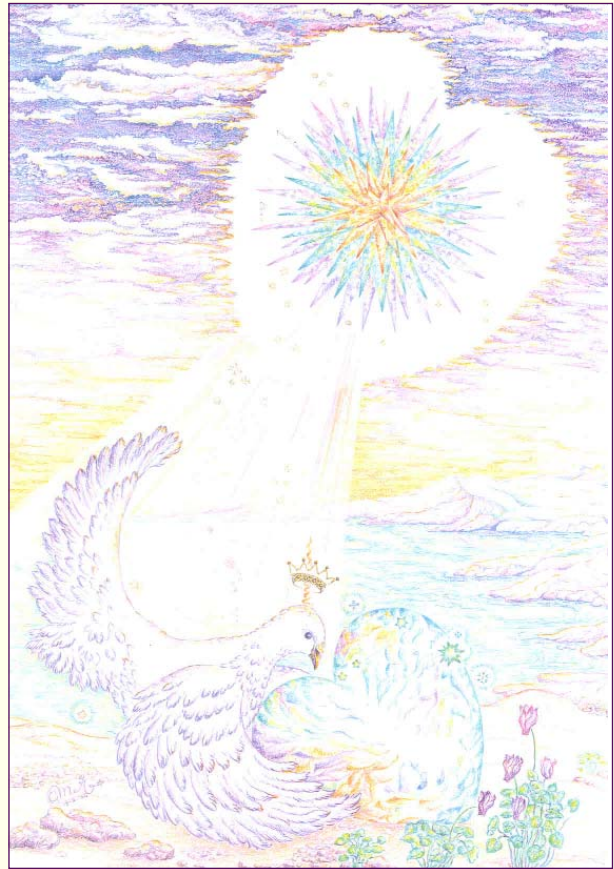
De Witte Duif met het lichtende hart

Grote zieners en profeten putten hun informatie via hun bewustzijn uit de akasha van het leven. De zieners die leefden toen de maya-kalender en de kalender van de